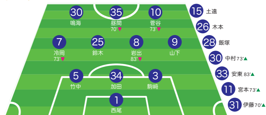
前期3節・4/24・栃木シティフットボールクラブ(AWAY)