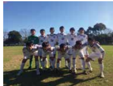
↑石岡アセンブル戦スターティングメンバー