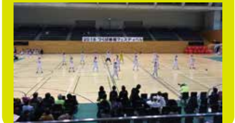
本番では練習よりも良い演技を見ることができました!!